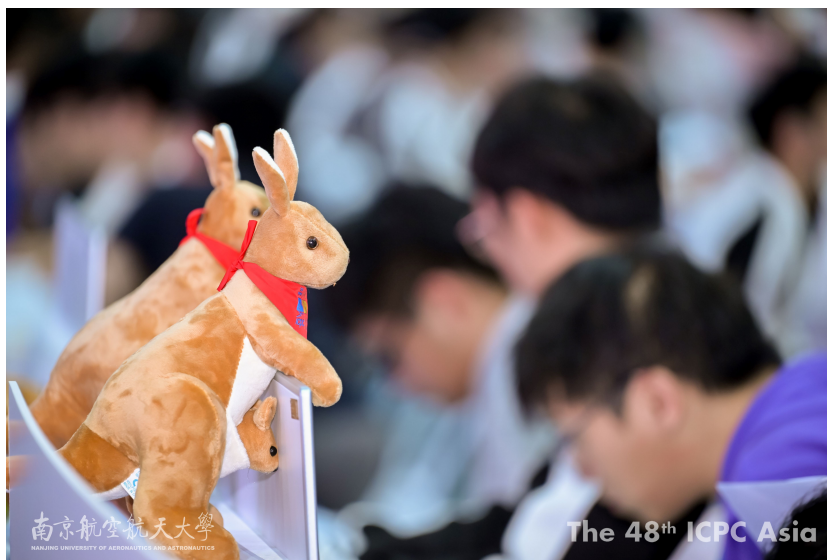
在 2023 ICPC 国际大学生程序设计竞赛亚洲区域赛（南京站）中拍摄的照片

今年，将会有约 335 支队伍参与南京站的竞赛。本次竞赛将会颁发至多 33 项金奖，66 项银奖与 99 项铜奖（数字仅供参考）。让我们期待选手们出色的表现！我们还想要感谢竞赛组委会与志愿者们们的努力付出。感谢你们为本次竞赛做出的贡献！