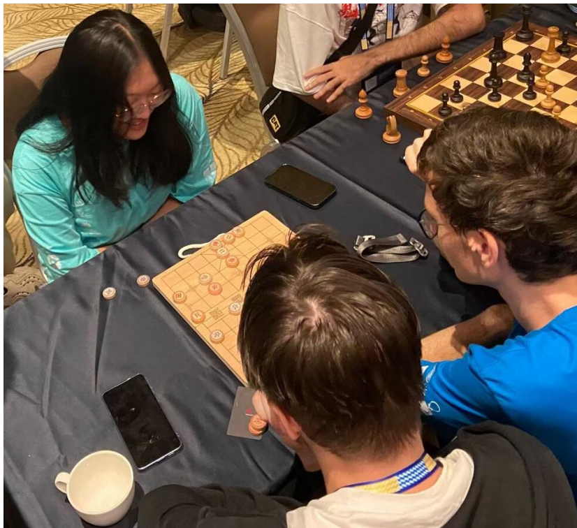
摄于第 49 届 ICPC 国际大学生程序设计竞赛世界总决赛现场

中国象棋是一项老少皆宜的热门运动，此事在第 49 届 ICPC 国际大学生程序设计竞赛世界总决赛的现场亦有记载。